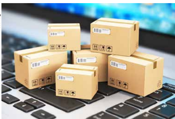
A logtech foca nas soluções para melhoria da entrega de uma determinada empresa e não na execução da entrega em si.

O mesmo raciocínio vale aos aplicativos de entrega de comida, uma das áreas que mais cresceram entre as logtechs nos últimos anos. As startups de entrega receberam mais de 70%