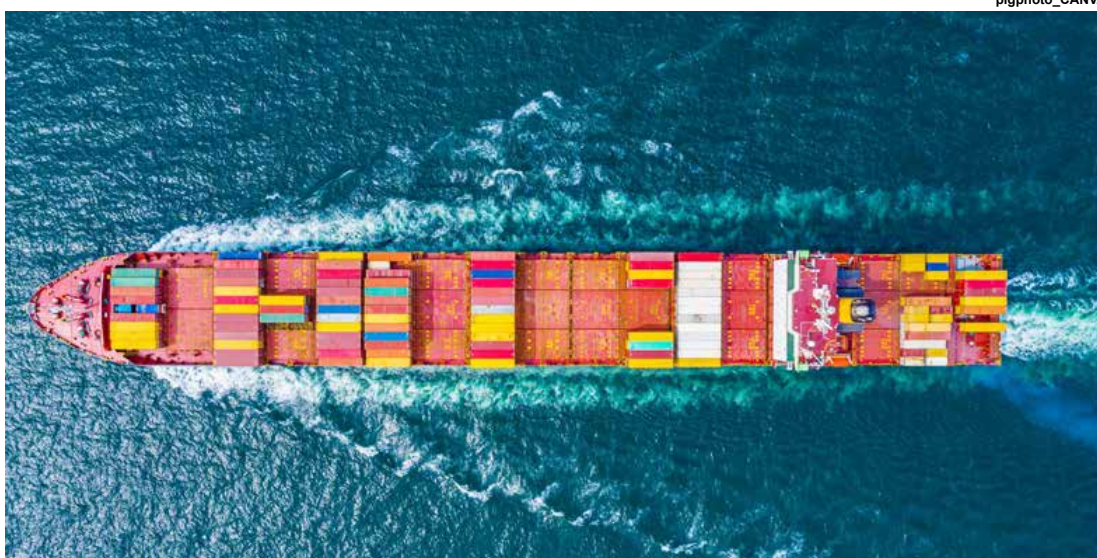
A intenção principal da mudança é agilizar os processos e garantir mais segurança às ações de importação e exportação.

Nesses locais, é possível ainda realizar atividades como embarque, desembarque, movimentação e despacho de cargas. Os mais populares são os portos, os terminais aeroportuários de cargas, de passageiros e os pontos de fronteira. Esses estabelecimentos precisam contar com sistema próprio