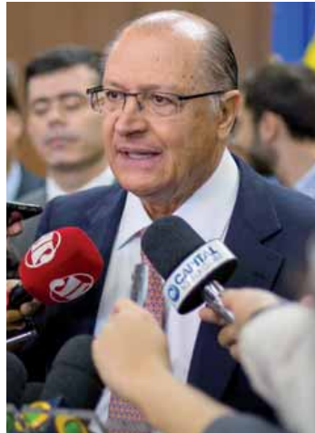
Alckmin: programas podem arrecadar cerca de R$ 2 bilhões.

A expectativa é que os programas resultem numa arrecadação total de cerca de R$ 2 bilhões e possam atingir até 1,711 milhão de contribuintes no caso do PPD e 282 mil no caso do ICMS. Os contribuintes pessoa física ou jurídica que quiserem aderir aos programas, que oferecem