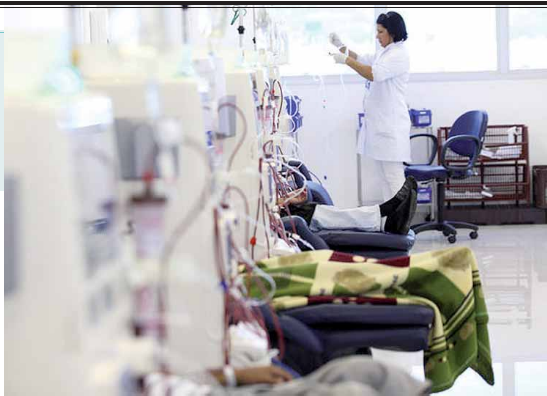
Barros disse que o maior problema do SUS está na gestão dos recursos.

Mesmo assim, ele reforçou ser uma cobrança justa exigir a permanência do médico em seu lugar de trabalho, algo que, de acordo com ele, não é cumprido por vários profissionais. “São 878 notificações contra gestores dizendo que profissionais