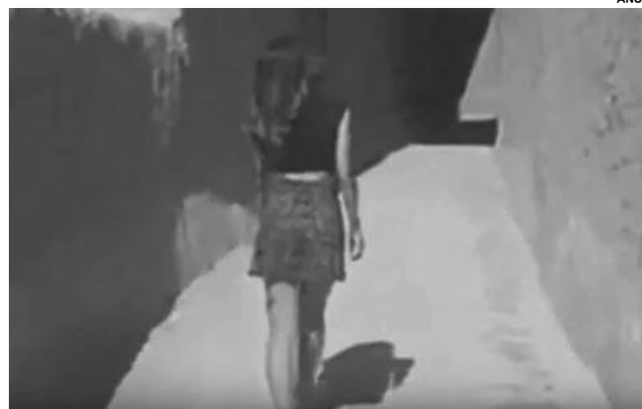
A garota admitiu ser ela no vídeo, mas que não sabia da repercussão que as imagens tinham causado.

A polícia da Arábia Saudita prendeu uma mulher após um vídeo em que ela aparece andando por uma rua vazia vestindo uma minissaia e um top viralizar na internet, relatou a TV estatal da Arábia Saudita, Ekhbariya. Naimagem, a mulher, cujo nome não foi divulgado, teria caminhado pela vila patrimonial Ushaiqir, a cerca de 200 km a noroeste da capital Riad, na província de Najd.