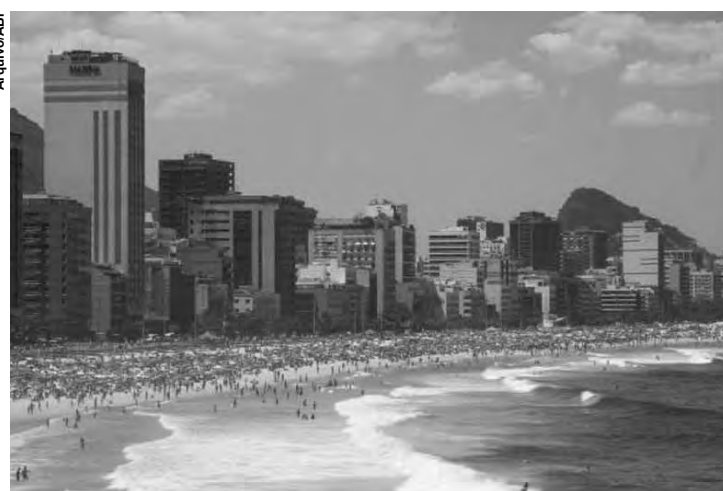
Com belas praias, o Rio de Janeiro é um dos destinos mais procurados por turistas.