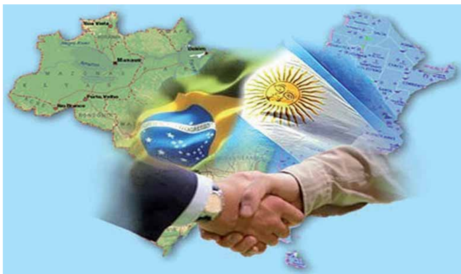
Os dois países juntos possuem 63% extensão total da América do Sul, 60% de seus habitantes e 61% do PIB.

país. "Isso pode custar muito caro no futuro porque já estamos com problemas nas fronteiras que podem se agravar se não tiver uma liderança ativa", acrescenta.