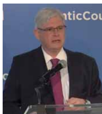
Rodrigo Janot em palestra no Brazil Institute, em Washington.

“Hoje, o Brasil está passando por três crises: ética, política e econômica. Para justificar a crise econômica e política é comum atribuir essas crises como consequências dessa grande investigação - a maior - na América Latina. O que costumamos dizer é que a crise econômica não resulta da investigação”. Janot ainda considerou que as investigações descobriram “um esquema de cartel que preju-