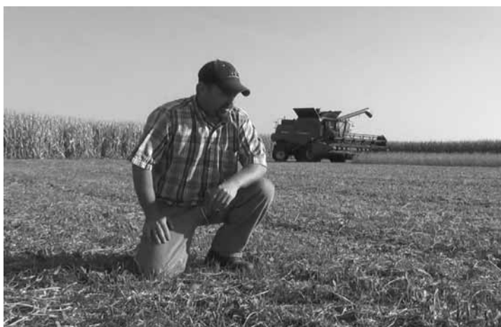
Houve perda de confiança em relação às condições do próprio negócio.

Essa queda foi fortemente percebida na indústria de insumos, antes da porteira, cuja confiança passou para 93,8 pontos, recuo de 15,5 pontos. "A comercialização de soja e milho esteve muito lenta no período, o que preju-