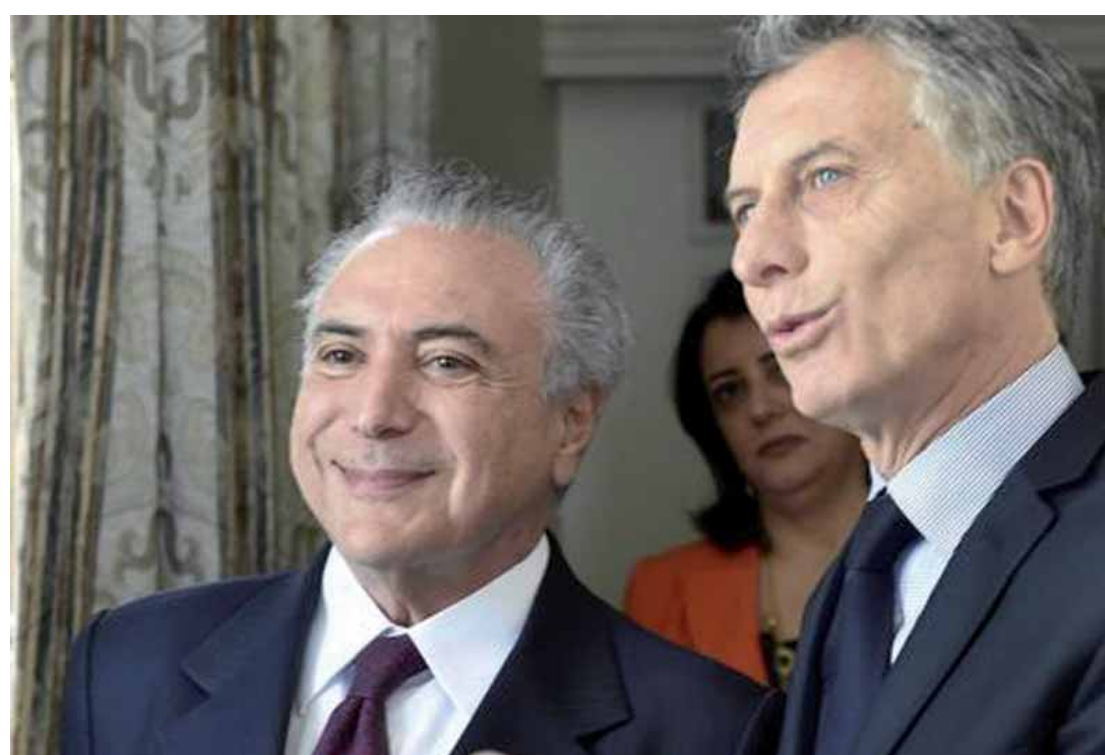
Michel Temer e Mauricio Macri durante encontro em Buenos Aires.

problema de "legitimidade". "O grande problema do Brasil é a legitimidade. É uma diferença bastante grande, já que Macri venceu eleições e Temer não. Mas, não é só isso que dá a legitimidade a um governo, que pode ser conseguida através de boas ações. Mas, do ponto de vista global, Temer não tem isso", afirmou.