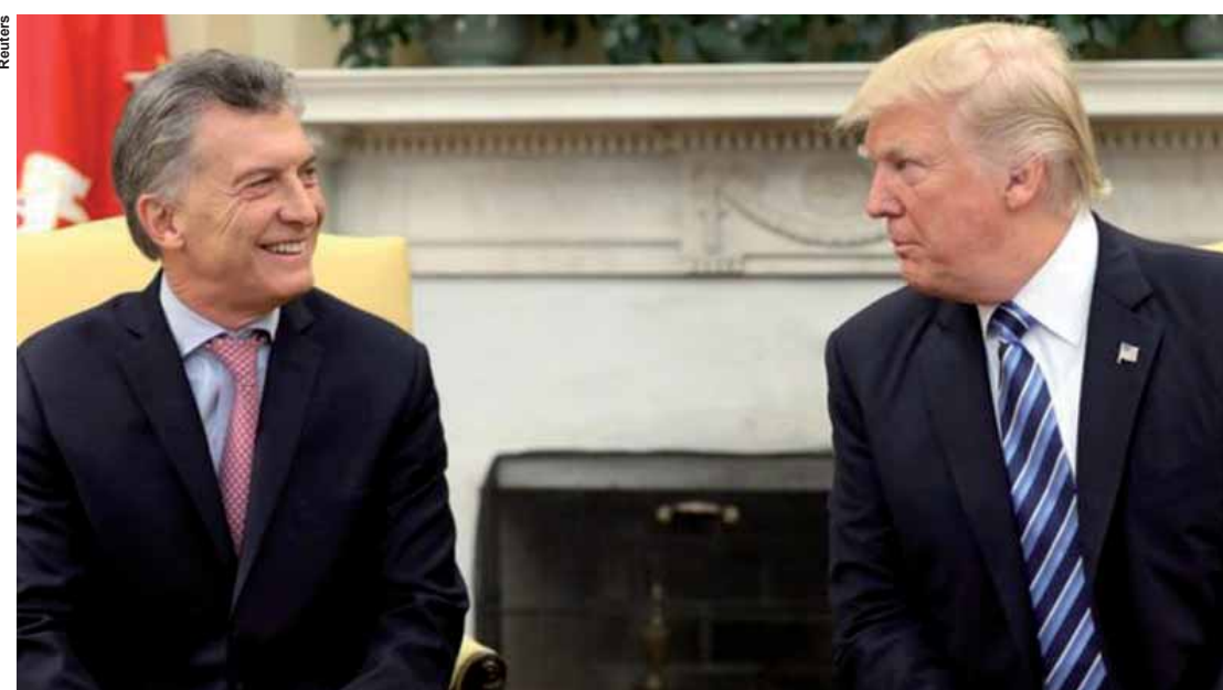
Macri fez viagens ao exterior, como Washington, para se reunir com o presidente norte-americano, Donald Trump.