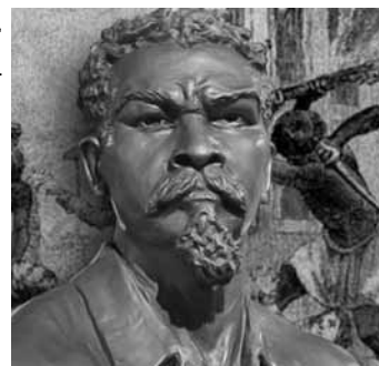
Busto de Francisco José do Nascimento.

Nascido em Canoa Quebrada, em 1839, Francisco José do Nascimento é conhecido como o “Dragão do Mar”, e é considerado o maior herói a favor da libertação dos escravos no Ceará. Foi pescador e marinheiro e liderou os jangadeiros de Fortaleza para que deixassem de transportar os cativos até os