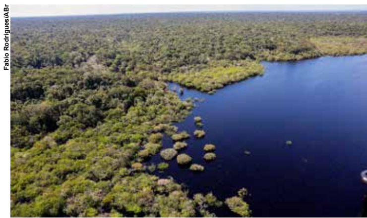
A iniciativa partiu de sete organizações sociais que atuam na região amazônica há mais de 30 anos.