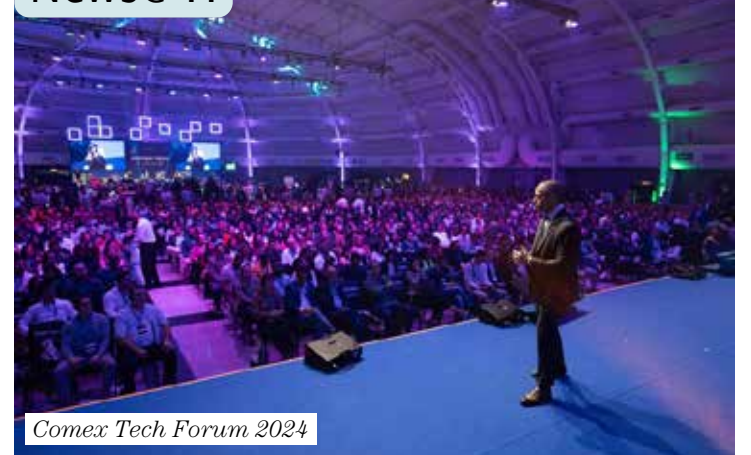
Comex Tech Forum 2024