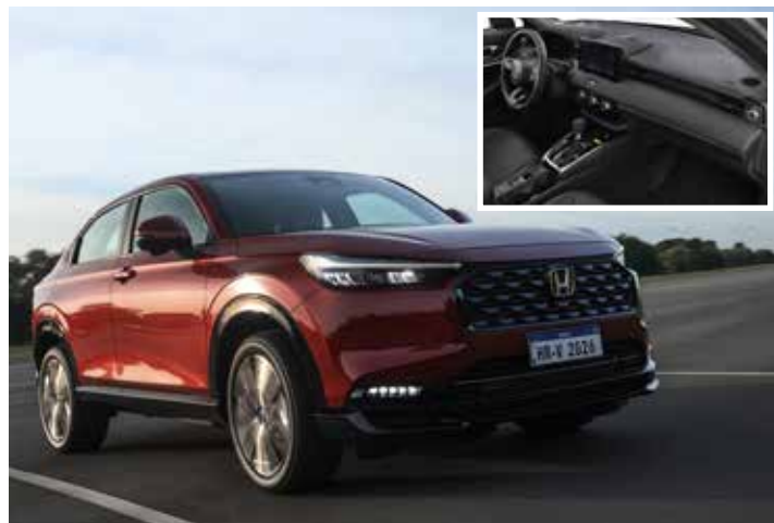
HR-V Touring 2026.

O HR-V tem apresentado crescimento expressivo nas vendas, sendo o segundo SUV mais vendido no mercado nacional no primeiro semestre, representando 46% das vendas da Honda, que cresceu 33% no período.