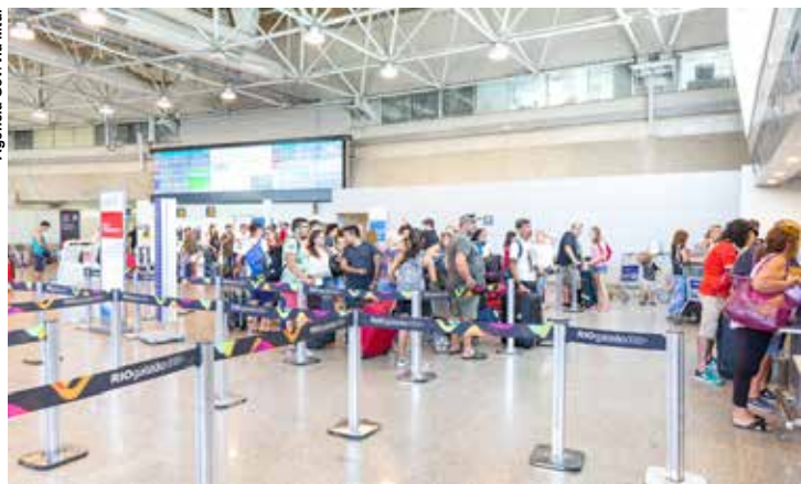
Em voos nacionais, o crescimento foi de 8,6%, com movimentação superior a 40 milhões de pessoas.

Em voos nacionais, o crescimento foi de 8,6%, com movimentação superior a 40 milhões de pessoas. “Estamos vivendo o melhor período da nossa aviação civil e os números comprovam isso. Se mantivermos esse ritmo no segundo semestre deste ano, vamos fechar 2025 com o melhor resultado da história. Isso significa um ganho expressivo não apenas para o nosso setor, mas para todos. Quando a aviação vai bem, o turismo vai bem, assim como a parte hoteleira e, principalmente,