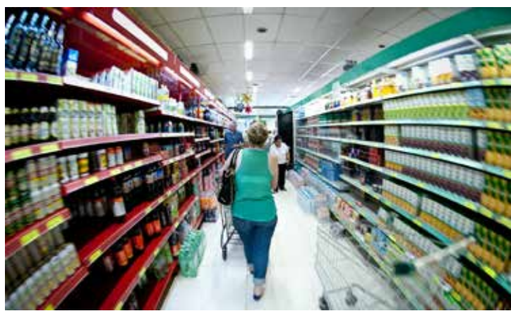
A variação nas proteínas de origem animal foi a mais importante.

Na análise de 12 meses o valor da cesta básica para o paulistano teve aumento de 2,27%. Puxaram a queda recente alguns dos produtos que tiveram maior destaque na alta da cesta entre abril de 2024 e 2025, como as carnes de primeira e de segunda, os ovos e o frango, além da batata e da cebola.