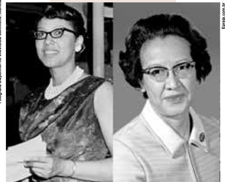
Dorothy Vaughan, Katherine Johnson (acima) e Mary Jackson (abaixo).

Katherine Johnson calculou as trajetórias que permitiram o pouso da Apollo 11 na Lua. Dorothy Vaughan foi pioneira no uso de computadores eletrônicos na agência e Mary Jackson se tornou a primeira engenheira negra da NASA. Sem elas, talvez o feito mais icônico da exploração espacial não tivesse acontecido. Suas histórias permaneceram restritas a relatórios técnicos até serem popularizadas pelo livro e filme Estrelas Além do Tempo. Hoje, inspiram gerações de meninas que sonham em ser cientistas.