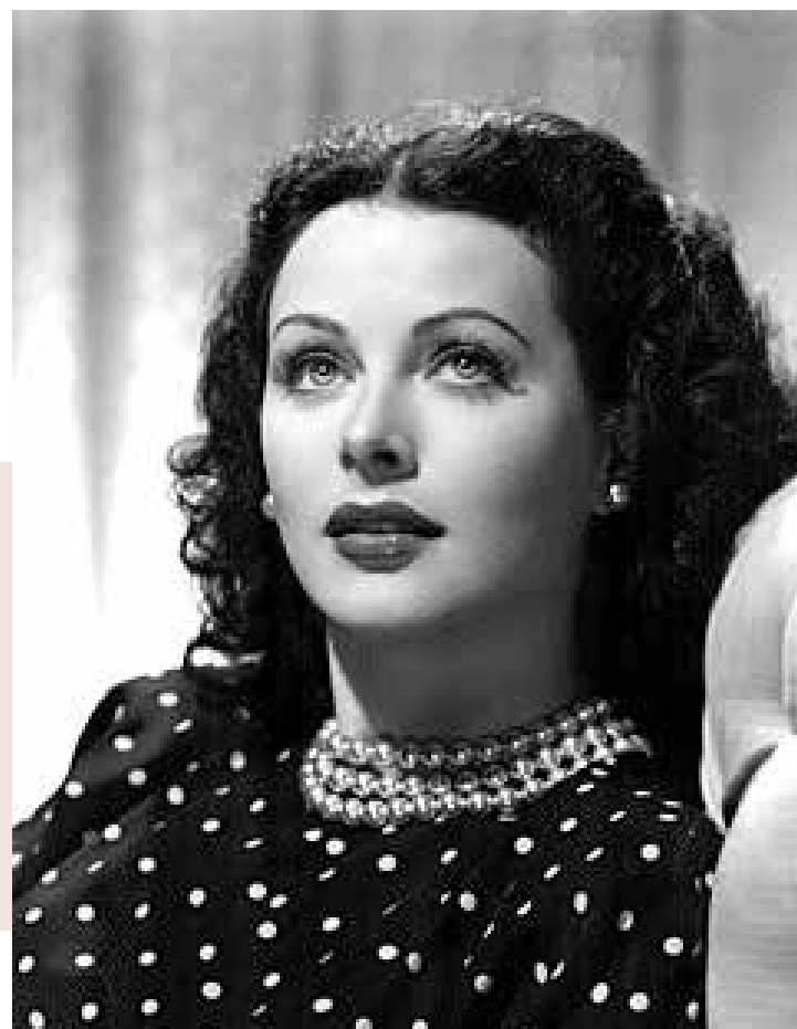
Retrato publicitário de Hedy Lamarr, década de 1940.

Já nos anos 1980, a cientista da computação Radia Perlman criava o protocolo Spanning Tree, peça-chave para a comunicação entre redes de computadores. Sem ele, a internet simplesmente não funcionaria como conhecemos hoje. Apelidada de "mãe da internet", Radia ainda é menos lembrada do que outros homens da mesma época, mas sua contribuição é a base para que bilhões de pessoas estejam conectadas.