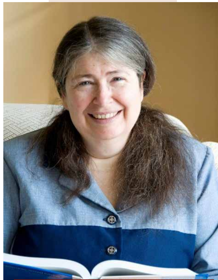
Radia Perlman, cientista da computação conhecida como "mãe da internet".

Nos anos 1940, quando o mundo olhava para Hollywood, a atriz Hedy Lamarr se tornava famosa por sua beleza nas telas. Mas, nos bastidores, ela desenvolvia ao lado do engenheiro George Antheil um sistema de comunicação por "salto de frequência" para proteger mensagens militares contra interceptações. À época, a invenção foi ignorada. Décadas depois, o mesmo princípio serviu de base para Wi-Fi, Bluetooth e GPS, tecnologias sem as quais não conseguiríamos trabalhar, viajar ou nos conectar hoje em dia. Hedy só recebeu reconhecimento já no fim da vida, mas sua trajetória é prova de que muitas vezes a história demorou demais para enxergar as mulheres por trás de inovações que transformaram o cotidiano.