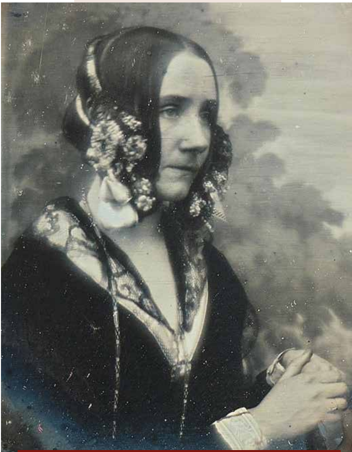
Retrato de Ada Lovelace, cerca de 1840. Fotografia em daguerreótipo

No século XIX, Ada Lovelace ousou romper barreiras. Filha do poeta Lord Byron, foi incentivada pela mãe, Lady Byron, a se dedicar à matemática e às ciências exatas. Essa decisão mudou sua vida e a história da computação. Ada escreveu o que é considerado o primeiro algoritmo do mundo e foi a primeira a imaginar que máquinas poderiam ir além dos cálculos, criando música, arte e linguagens simbólicas. Sua visão, muito à frente do tempo, antecipou conceitos da computação moderna e até da inteligência artificial. Apesar de esquecida por quase um século, hoje é reconhecida como a primeira programadora da história e um símbolo de pioneirismo feminino.