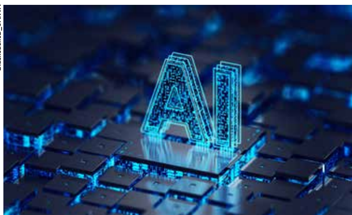
Em dois anos, o número de empresas com atuação na área industrial que utilizam a tecnologia de IA mais que dobrou.

No primeiro semestre do ano passado, 41,9% das empresas industriais pesquisadas faziam uso da IA, enquanto essa marca era de 16,9% dois anos antes.