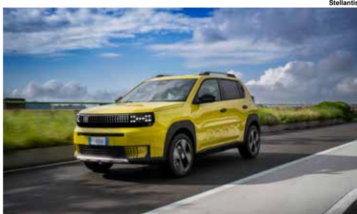
Fiat Panda vai inspirar futuros compactos.

A marca também planeja lançar novas gerações de modelos de maior volume, como Strada, Toro, Fastback e Pulse, além de considerar um SUV inédito de sete lugares. A estratégia se apoia em pilares como custo competitivo, eletrificação e conectividade.