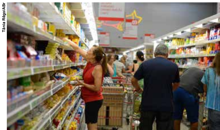
A estimativa das instituições financeiras para o crescimento da economia este ano passou de 2,16% para 2,17%.

A estimativa foi publicada no boletim Focus de ontem (20), pesquisa divulgada semanalmente pelo Banco Central (BC) com a expectativa de instituições financeiras para os principais indicadores econômicos. Para 2026, a projeção da inflação também caiu, de 4,28% para 4,27%. Para 2027 e 2028, as previsões são de 3,83% e 3,6%, respectivamente.