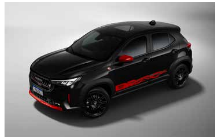
Pulse Abarth Stranger Things.

O Pulse Abarth possui motor turbodiesel de 1,3 litro de 185 cv e custa R$ 157.990.