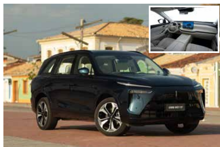
GWM Wey 07.

Seu design externo apresenta faróis full led, rodas de 21", sensor de abertura elétrica e diversas opções de cores. Equipado com sistema de som premium, ar-condicionado digital de três zonas e funções como Vehicle-to-Load, o Wey 07 está à venda por R$ 429 mil.