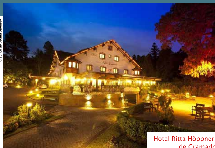
Hotel Ritta Höppner, de Gramado