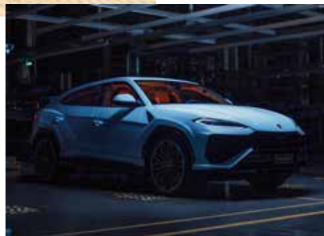
Lamborghini Urus SE 2025