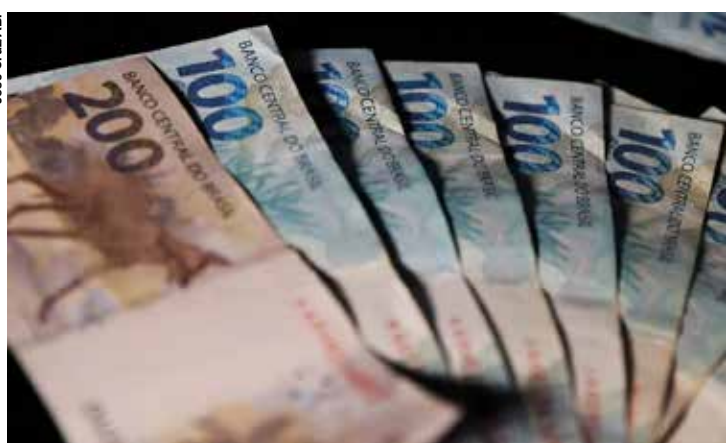
O Inovacred segue atrativo com condições a partir de TR+6,068% a.a. e até 96 meses de prazo total, com 24 meses de carência.

Ao todo, serão disponibilizados R$ 1 bilhão em recursos do Fundo Nacional de Desenvolvimento Científico e Tecnológico (FNDCT) para fomentar a inovação e ampliar a competitividade nacional. Ao menos R$ 300 milhões serão destinados às regiões Norte, Nordeste e Centro-Oeste. Todos os projetos submetidos deverão ser contratados até 31 de dezembro deste ano.