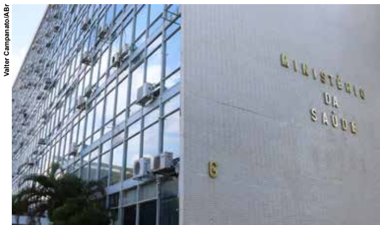
Caso haja necessidade, o governo informou que vai montar hospitais de campanha e expandir estruturas existentes.

Em nota, o ministério informou que estrutura um plano de contingência para resposta do SUS a um “possível agravamento da crise internacional e avanço da demanda de migrantes na região fronteiriça” após ataque conduzido pelo governo norte-americano.