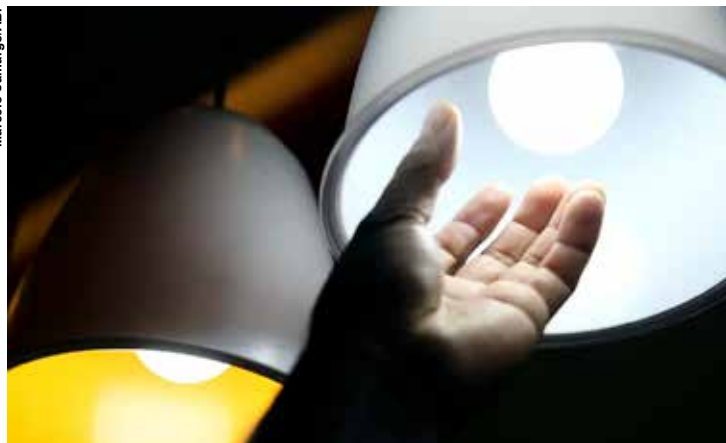
Conta de luz e passagem aérea ajudaram a segurar o IPCA-15.

Os dados foram divulgados ontem (27) pelo Instituto Brasileiro de Geografia e Estatística (IBGE). Dos nove grupos de produtos e serviços pesquisados pelo IBGE, dois apresentaram recuo na média de preços na passagem de dezembro para janeiro. Dentro do grupo habitação, a conta de luz recuou 2,91%, sendo o preço que mais puxou a média da inflação do mês