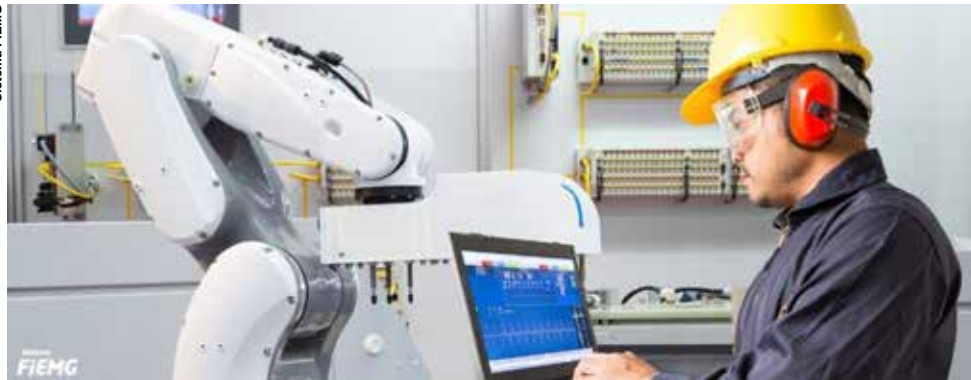
O motivo para a indústria patinar no fim do ano é a política monetária restritiva.

O IBGE apurou que em dezembro a produção das indústrias do país caiu 1,2%, o pior resultado desde julho de 2024 (-1,5%). Dos últimos quatro meses do ano, três foram queda e um (outubro) teve variação nula. O desempenho de 2025 coloca a indústria em um patamar 0,6% acima do período pré-pandemia da Covid-19 (fevereiro de 2020) e 16,3% abaixo do ponto mais alto já alcançado, em maio de 2011.