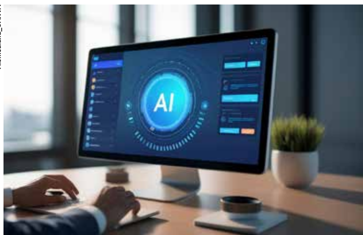
tor Geral do LinkedIn para a América Latina.