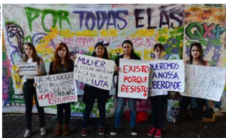
Em metade dos casos, o abusador foi um familiar e, em um terço dos relatos, foi um amigo ou conhecido da família.

A diretora de conteúdo do Instituto Patrícia Galvão,