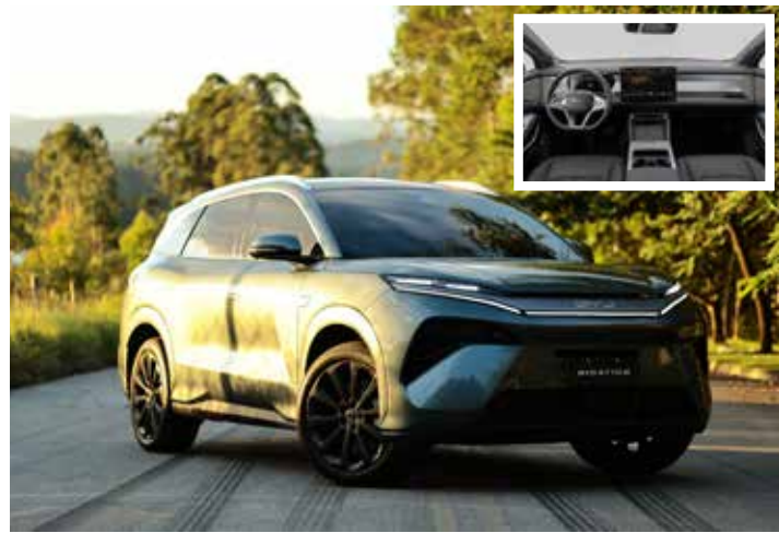
BYD Atto 8.

A BYD também lançou oficialmente no Brasil o Atto 8, SUV híbrido plug-in de 7 lugares que estreia a plataforma DM-P. O modelo tem potência combinada de 488 cv e aceleração de 0 a 100 km/h em 4,9 segundos. Com 5,04 metros de comprimento e entre-eixos de 2,95 metros, custa R$ 399.990.