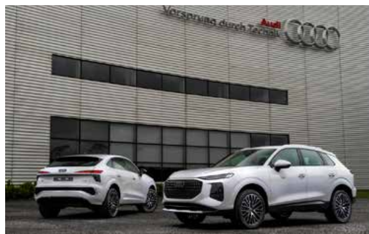
Audi Q3 2026.

Em relação à geração anterior, a nova versão do Q3 adota a linguagem visual da marca com faróis afilados, grade singleframe com bordas curvas e colmeia interna em novo padrão, além dos anéis Audi em formato 2D. Na traseira, as lanternas são distribuídas em dois níveis e interligadas pela tampa do porta-malas, com iluminação vermelha nos anéis da marca. No interior, o painel passa a incorporar tela panorâmica curvada. Os preços ainda não foram divulgados.