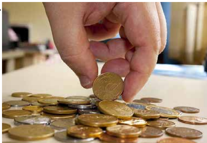
O cenário é reflexo direto da política monetária restritiva.

Este é o maior nível de endividamento de toda a série histórica da pesquisa feita mensalmente pela Confederação Nacional do Comércio de Bens, Serviços e Turismo (CNC) desde 2010.