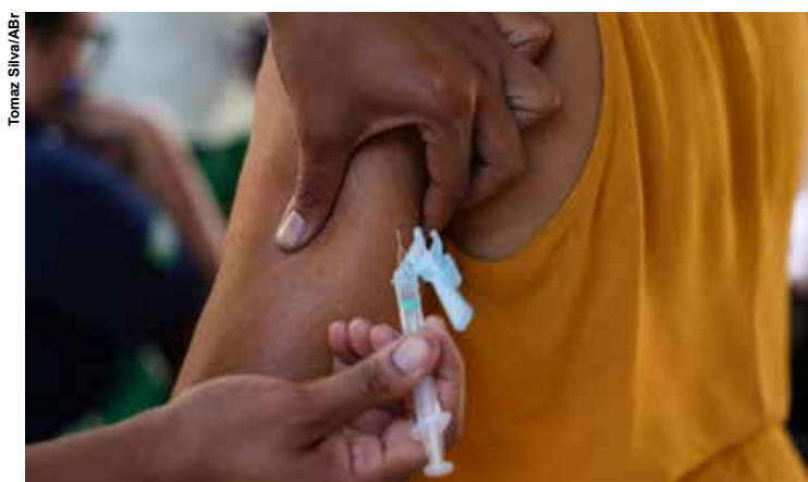
O sarampo é uma doença de altíssima transmissibilidade, especialmente entre os não vacinados.

A bebê ainda não tinha idade para receber a vacina, já que o calendário do Sistema Único de Saúde prevê a aplicação da primeira dose da tríplice viral aos 12 meses, o que garante a proteção contra o sarampo, a caxumba e a rubéola. Aos 15 meses, as crianças devem receber uma dose da tetra viral, que reforça a imunidade contra essas três doenças e acrescenta a catapora na lista.