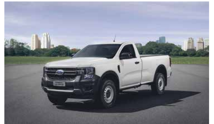
Ford Ranger XL 2026, cabine simples.

Os preços partem de R$ 248.600 para a chassi cabine manual e chegam a R$ 282.600 na cabine dupla automática.