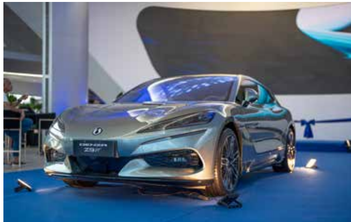
Denza Z9 GT.

A meta é instalar mil carregadores Flash no Brasil até o fim de 2027. O primeiro modelo compatível com a tecnologia será o cupê elétrico Z9 GT, próximo lançamento da marca no país.