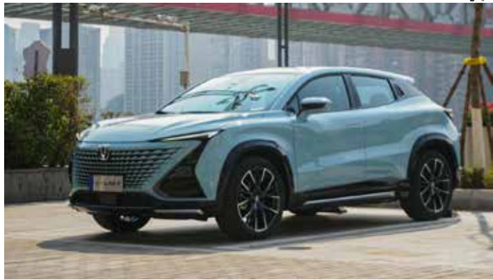
Caoa Changan Unit T.