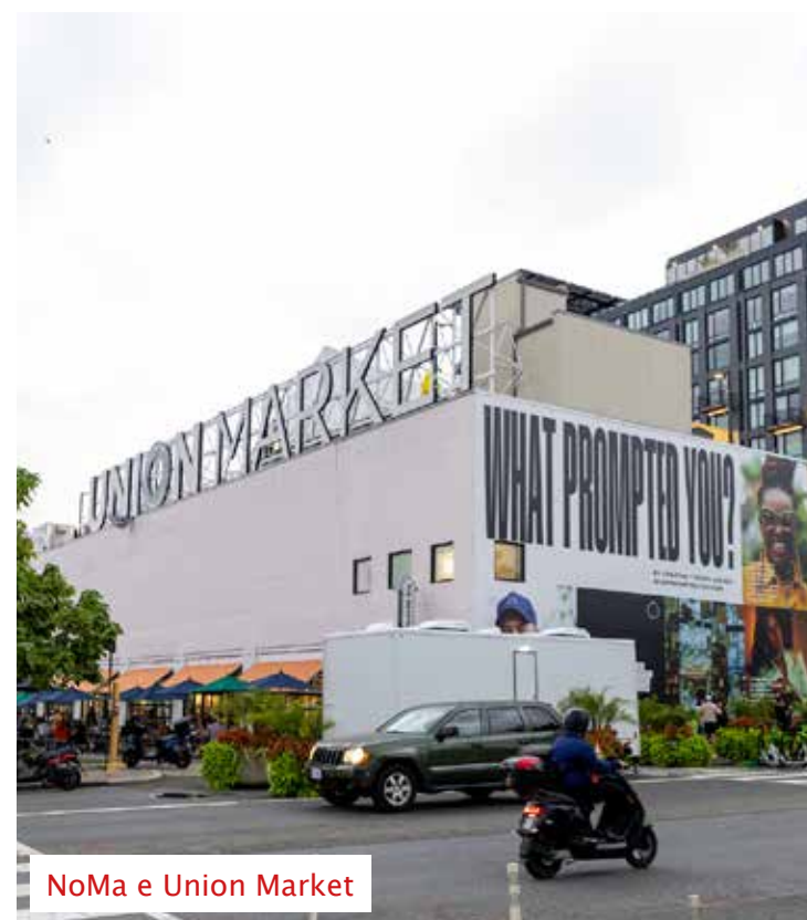
NoMa e Union Market