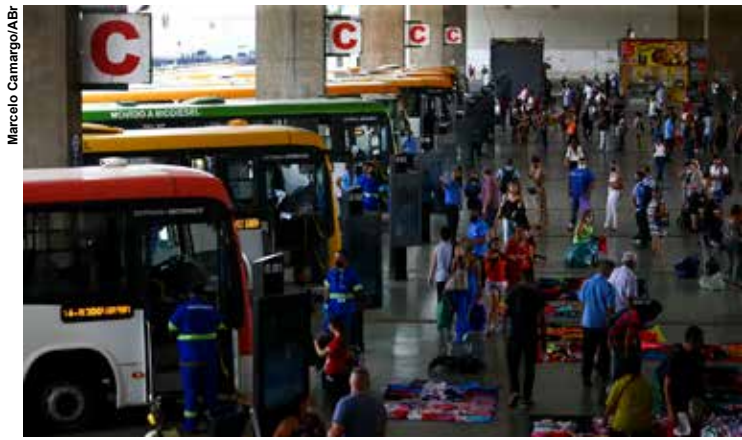
A gratuidade poderia ser tratada como um direito social, nos moldes do SUS ou da Educação Pública.

Essa é a principal conclusão de um estudo divulgado por pesquisadores da Universidade de Brasília (UnB) e da Universidade Federal do Rio de Janeiro (UFRJ).