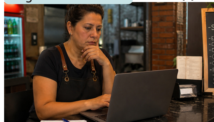
Imagem gerada com IA